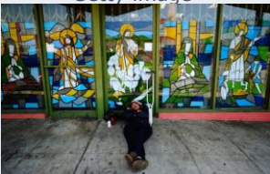
Sans abri à Los Angeles