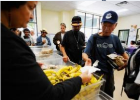
Distribution de repas 2011