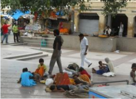
Pauvreté en Inde