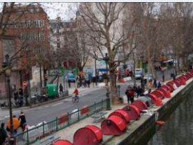
Tentes de SDF à Paris