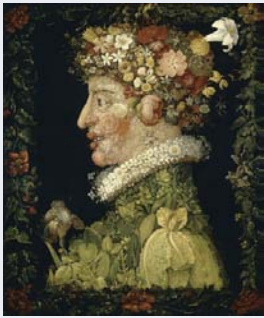
Le printemps de G. Arcimboldo