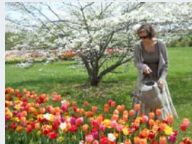
Le plaisir du jardin