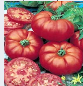
Tomates de Marmande