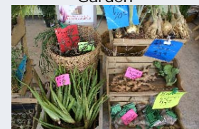
Plantes du jardin