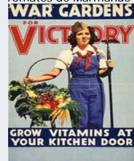
WWII Victory Garden