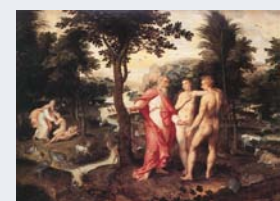
Le jardin d'Éden