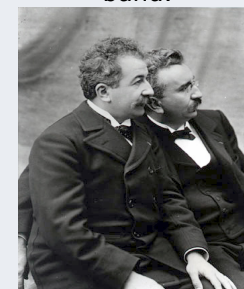
Les Frères Lumière