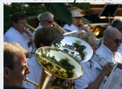
C'ville's municipal band.