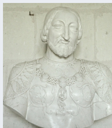
Buste de François 1 er © Hélele Rival