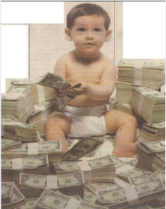
Argent et éducation.