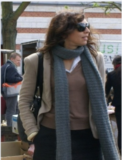
Autonomie et argent.