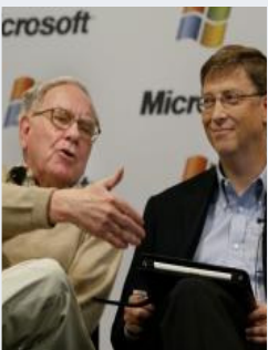
Donner son argent.