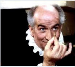
L'argent des français