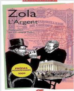
Le mépris de l'argent