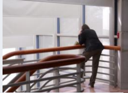
Où es-tu Chérie?