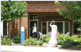
Solitude et attente.