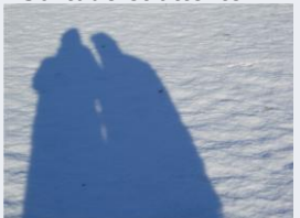
Se reconstruire à deux.