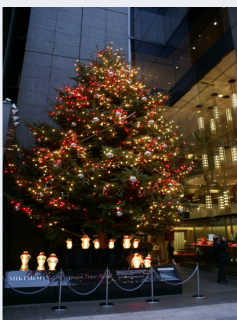
Sapin de Noël à Ginza Tokyo