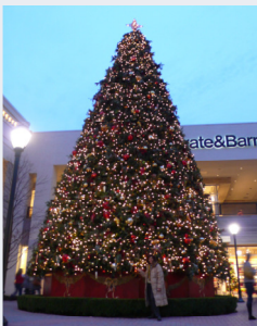
Sapin de Noël à Richmond