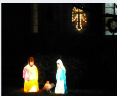
Crèche de Noël à Charlottesville