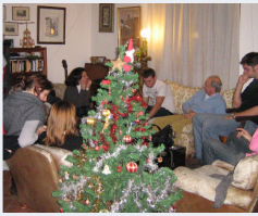
Noël en famille en France