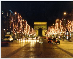
Décorations sur les Champs-Élysées