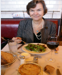
Dégustation à Cancan Richmond