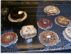
La vitrine d'un pâtissier à Paris