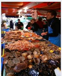
Jour de marché à Angers.