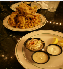
Coquillages à la Nouvelle-Orléans