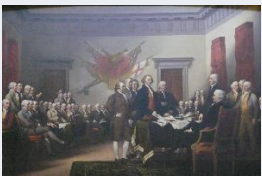
La Déclaration d'Indépendance, peinture de John Trumbull.