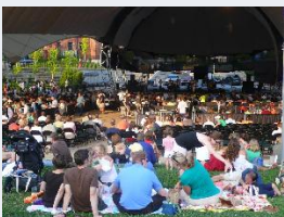
Friday After Five, bonheur en famille à C'ville.