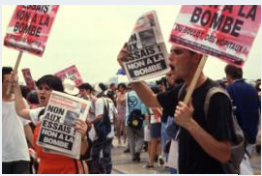
Non à la guerre !