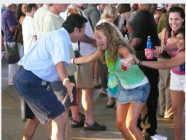
La danse comme expression du bonheur!