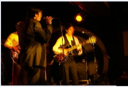
La Musique du bonheur! Concert «And this is max» à Paris.