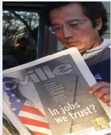
Consultation des créations d'emploi.