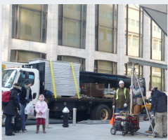
Hommes au travail à New-York City.