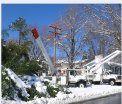
Hommes au travail à Charlottesville.