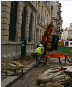
avaux de VRD à Paris