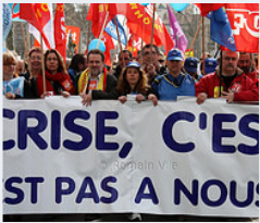
Manifestation pour le maintien de l'emploi