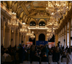
Hôtel de ville de Paris Festival de la Francophonie 2010.