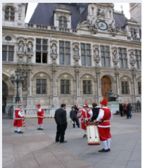
Culture et traditions Francophonie 2010