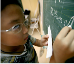
L'anglais à l'école primaire au Vietnam