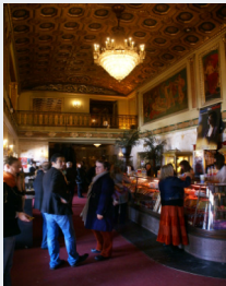
Byrd Theater Richmond Festival du film français